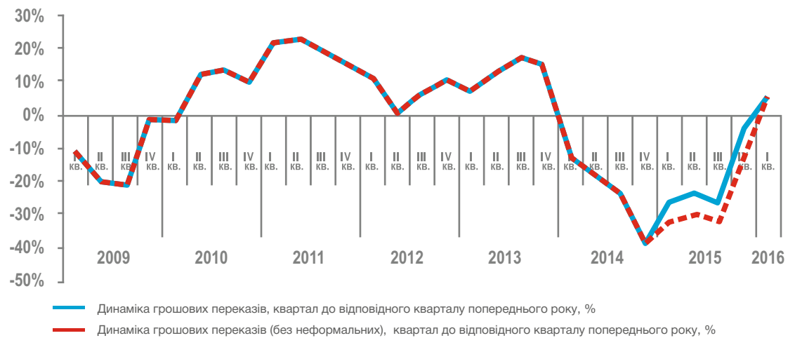
Рис. 1. Динаміка грошових переказів з урахуванням та без урахування зміни обсягів грошових переказів, надісланих неформальними каналами.

Не зовсім зрозумілим залишається, чому НБУ переглянув загальні обсяги грошових переказів, надісланих через міжнародні платіжні системи, і при цьому не змінив розмір грошових переказів цим каналом у розрізі основних країн надходження приватних переказів. У результаті незначне збільшення обсягів призвело до дещо швидшого відновлення за підсумками 2015 року частки міжнародних платіжних систем, скорочення якої часто пов'язують з регулюванням НБУ.