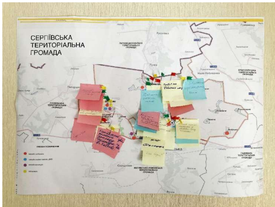
Результат роботи з мапами