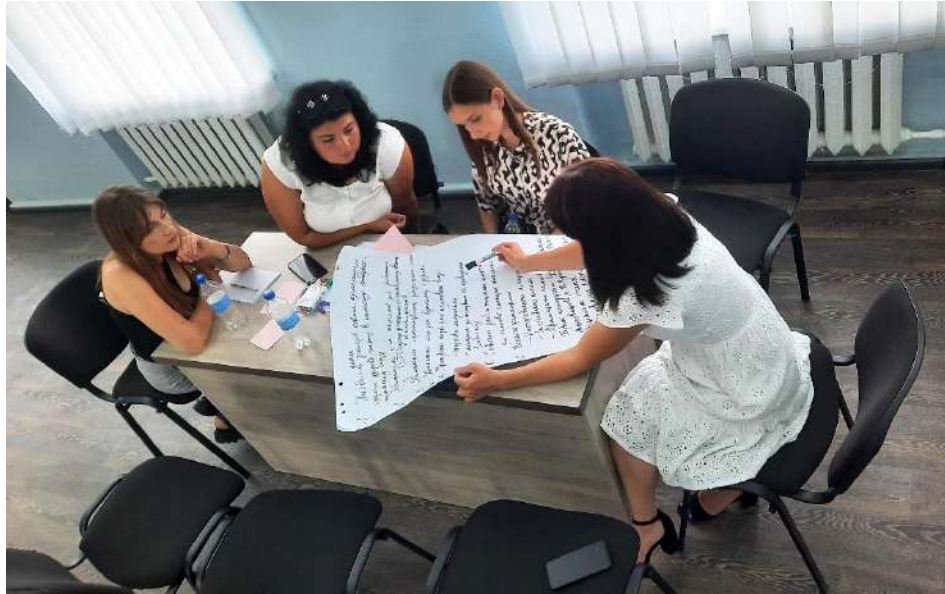
Обговорення в малих групах із метою збору пропозицій до «Комплексного плану» в Дунаєвецькій громаді.