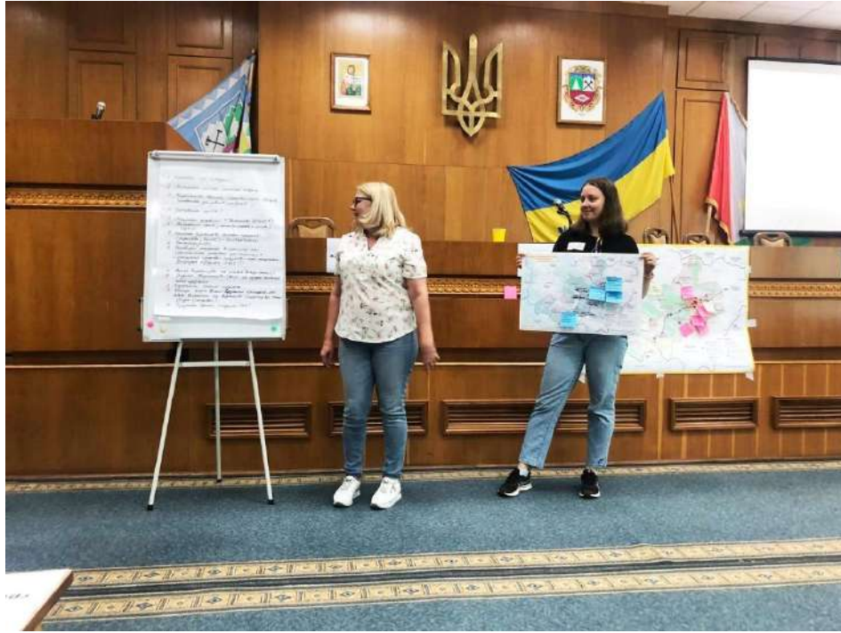
Презентація напрацювань щодо розробки «Комплексного плану просторового розвитку Косівської громади»

Додаток 5. Анкета для збору пропозицій щодо розроблення Комплексного плану просторового розвитку територій Косівської громади