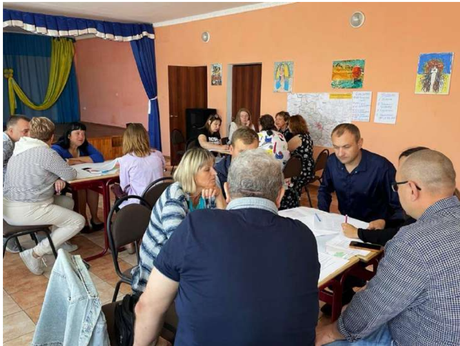
Обговорення з метою збору пропозицій до «Комплексного плану» в Малобубнівському старостатському окрузі

Проведення громадських обговорень у Пустовійтівському та Малобубнівському старостинських округах із залученням мешкан_ок для збору пропозицій щодо їхнього бачення розвитку цих округів. Події відбувалися у форматі «Світового кафе» – групових обговорень, де учасни_ці малими групами розглядали конкретні теми та сфери, постійно змінюючи столи дискусій. Зустріч відвідали понад 10 осіб у Малих Бубнах та 15 осіб – у Пустовійтівці. Метою зустрічей було обговорити проблеми громади та окремих населених пунктів, виявити сильні сторони та цінності в громаді, а також зібрати пропозиції щодо розвитку з метою підвищення якості життя у сферах мобільності, економіки, навколишнього середовища, освіти та культури, спадщини, благоустрою тощо.