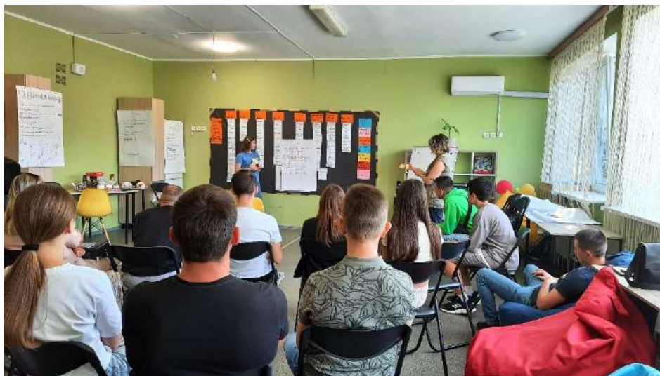
Презентація групової роботи над запитанням: «Що вже є хорошого у Валківській громаді?» — під час події залучення молоді