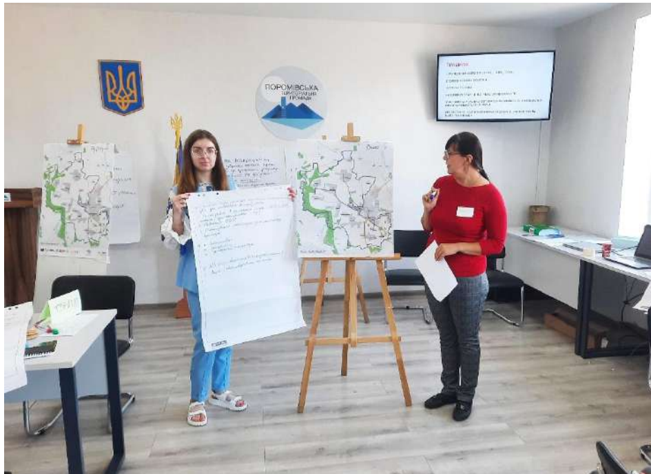
Презентація пропозицій до «Програми мобільності та доступності» у Поромівській громаді під час стратегічної сесії