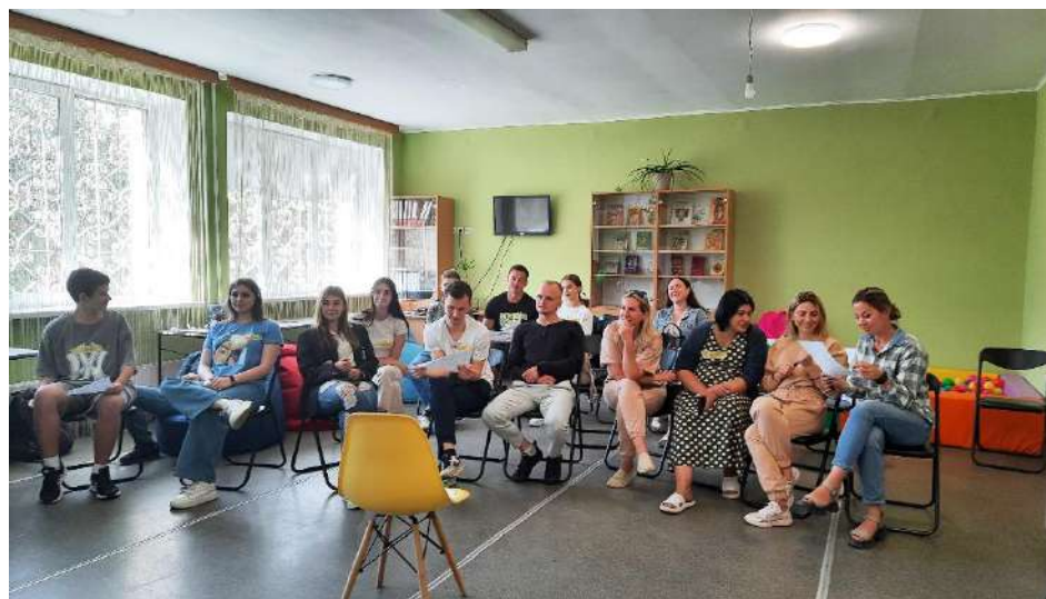
Групова робота під час події залучення молоді

Аналіз комунікації громади в публічному просторі. Громада поділилася своїми переживаннями щодо труднощів комунікації з населеннями, наявністю великої кількості негативних відгуків про діяльність органів влади, низької зацікавленості населення в новинах про розвиток громади. Експерт_ки з залучення проаналізували сторінки в соціальних мережах, де органи місцевого самоврядування публікують новини громади, а також відкриті групи, створені мешкан_ками громади для відкритих обговорень діяльності ОМС. Для того, щоб допомогти громаді налагодити спілкування з населеннями, навчити працювати з негативними коментарями, підвищити навички доступно розповідати про свою діяльність, експерт_ки з залучення провели тренінг з публічної комунікації.