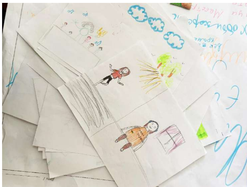
Створені під час події з молоддю ментальні мапи

Додаток 8. Анкета для Шабівської громади