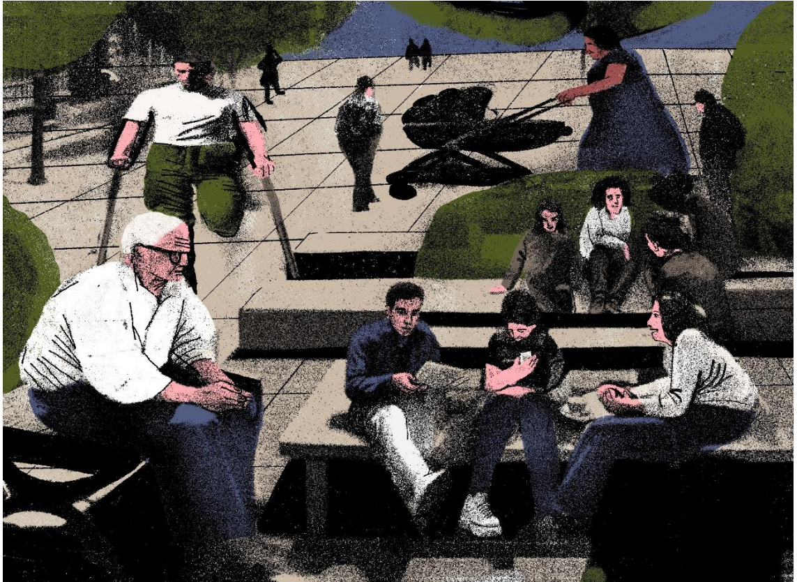
Ілюстрація студії «Сері/граф» до блогу аналітика Cedos Валерія Мілосердова «Центри спільнототворення: спільні простори, спільні потреби, спільні виклики»