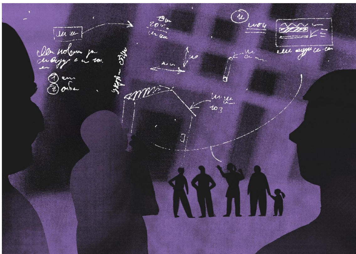
Ілюстрація студії «Сері/граф» до аналітичної записки «Основні засади державної житлової політики: рекомендації до розробки закону»