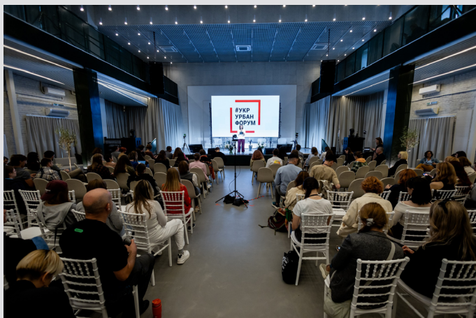
Відкриття Українського урбаністичного форуму 2025 в Луцьку.

містян_ок до житла, соціального захисту, мобільності, як створювати міський простір, що сприятиме зміцненню спільнот і якісному дозвіллю.