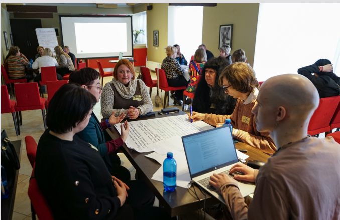
Подія «Житло і соціальний захист у прифронтових громадах», лютий 2025.

У лютому 2025 року відбувся валідаційний воркшоп, який зібрав представни_ць громад 14 прифронтових сільських і селищних громад. Упродовж трьох днів понад 20 учасни_ць обговорили проблеми прифронтових громад у сферах житла та соціального захисту, визначили можливі шляхи їх вирішення і необхідні для цього зміни. Напрацьовані пропозиції та ідеї включено до аналітичних записок про житло і соціальний захист у прифронтових громадах.