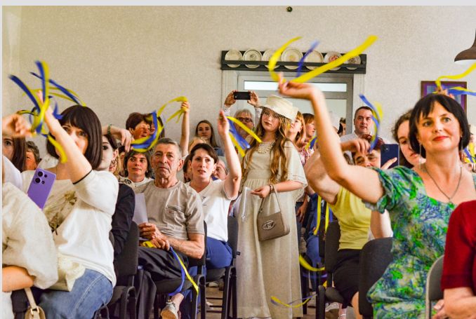
Відкриття центру спільнототворення в селі Вікно на Тернопільщині, липень 2025.

Ми продовжили популяризувати важливість справедливого і сталого міського та місцевого розвитку. Так, у Луцьку відбувся сьомий Український урбаністичний форум «Людський масштаб», який зібрав близько 350 учасни_ць. Під час події ми обговорювали, як сталі інституції, людиноцентричні міські політики, а також доступна інфраструктура можуть сприяти соціальному розвитку та подоланню нерівностей. Разом ми шукали відповіді на питання, як пом’якшувати наслідки війни та демографічних викликів, як посилювати людський потенціал і гарантувати доступ