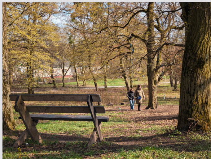
Парк в Острозі, осінь 2025.

Наша команда продовжує підтримувати українські міста на шляху до кліматичної нейтральності. Протягом